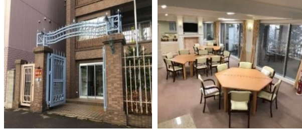
デイサービス我が家 円山公園 TEL:011-206-1851