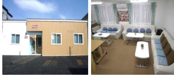
デイサービス我が家 手稲の家 TEL:011-215-8223