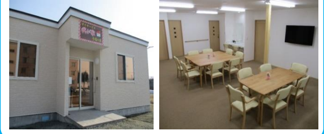
デイサービス我が家 西野の家 TEL:011-215-4461