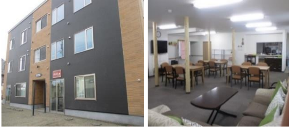
デイサービス我が家 北郷の家 TEL:011-598-0961