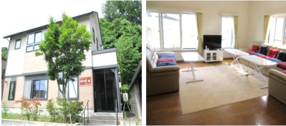
デイサービス我が家 山鼻の家 TEL:011-520-7107